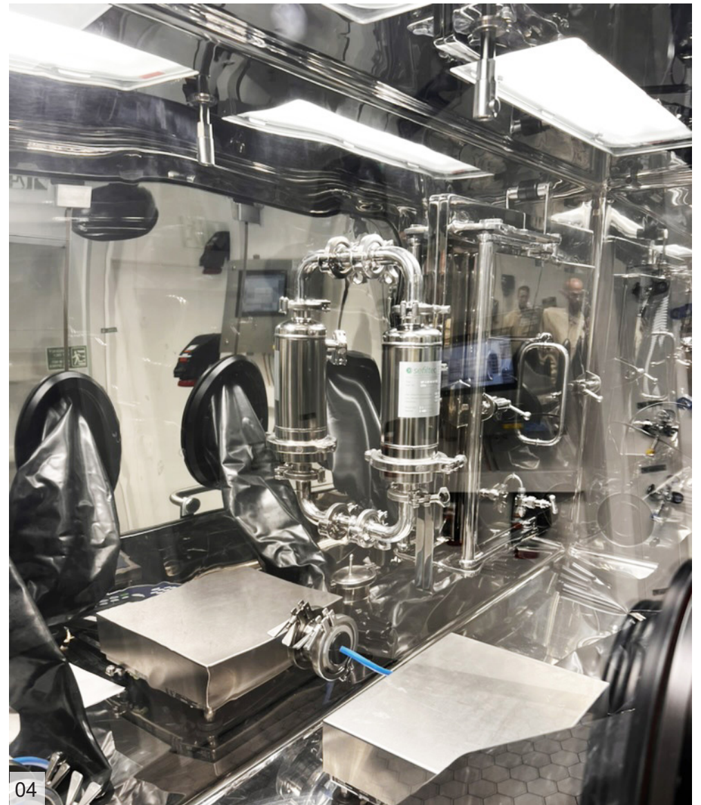
Dispensing Isolator | Merck & Cie KmG | Switzerland