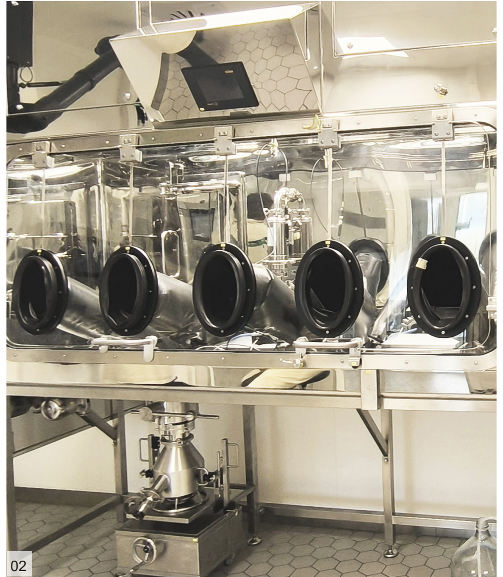
Dispensing Isolator | Merck & Cie KmG | Switzerland