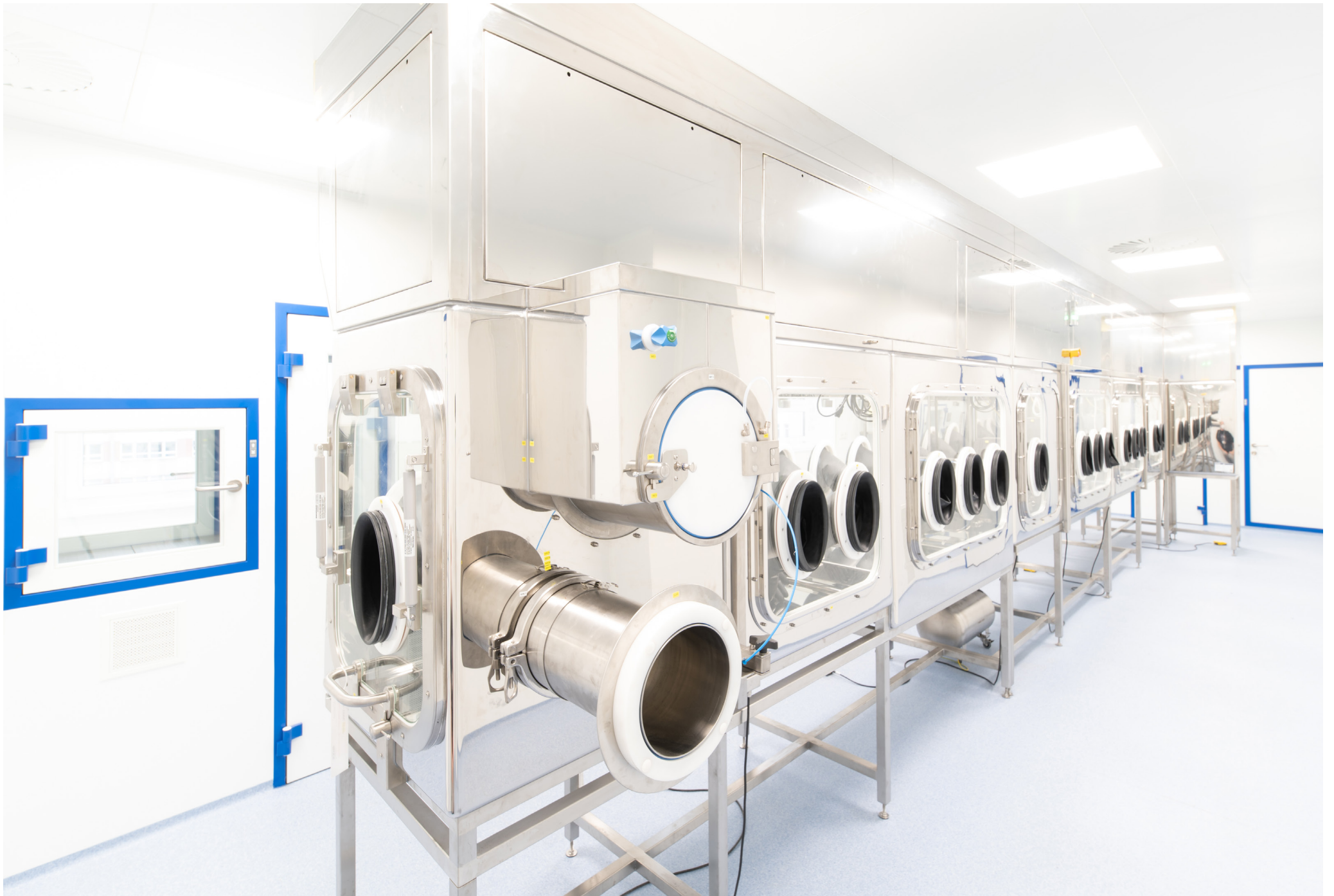
Isolator Workplace for API Production | Cayman Pharma, s.r.o. | Czech Republic