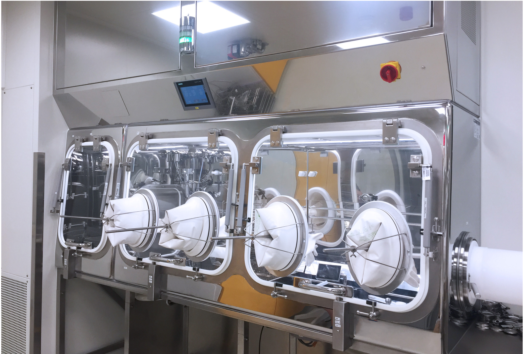
Isolator for sterility test | Praha Vaccines a.s. | Czech Republic