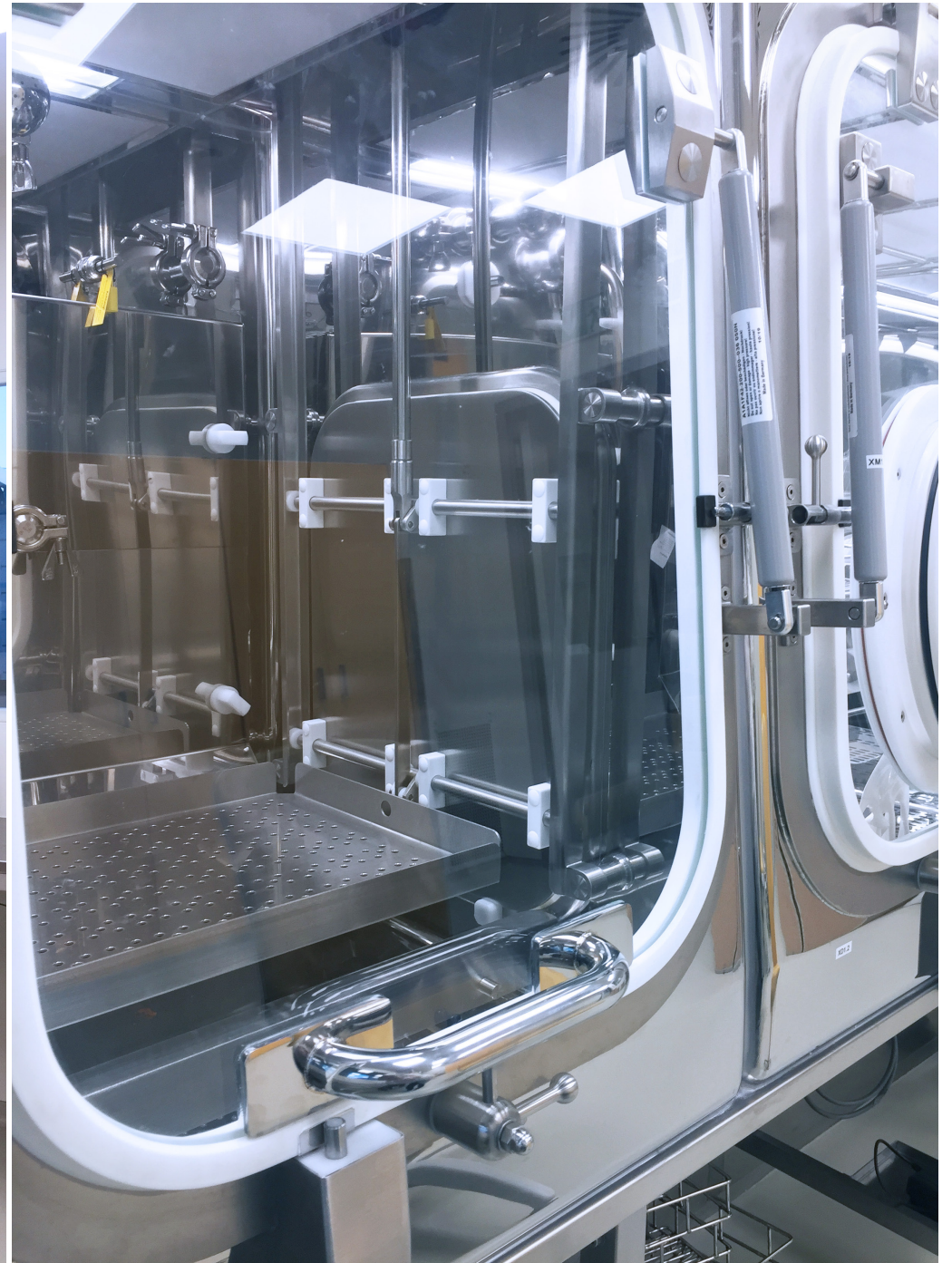
Isolator for sterility test | Praha Vaccines a.s. | Czech Republic